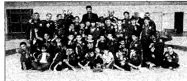
Les poussins et benjamins du club prouvent que le Cavigal a de l'avenir.