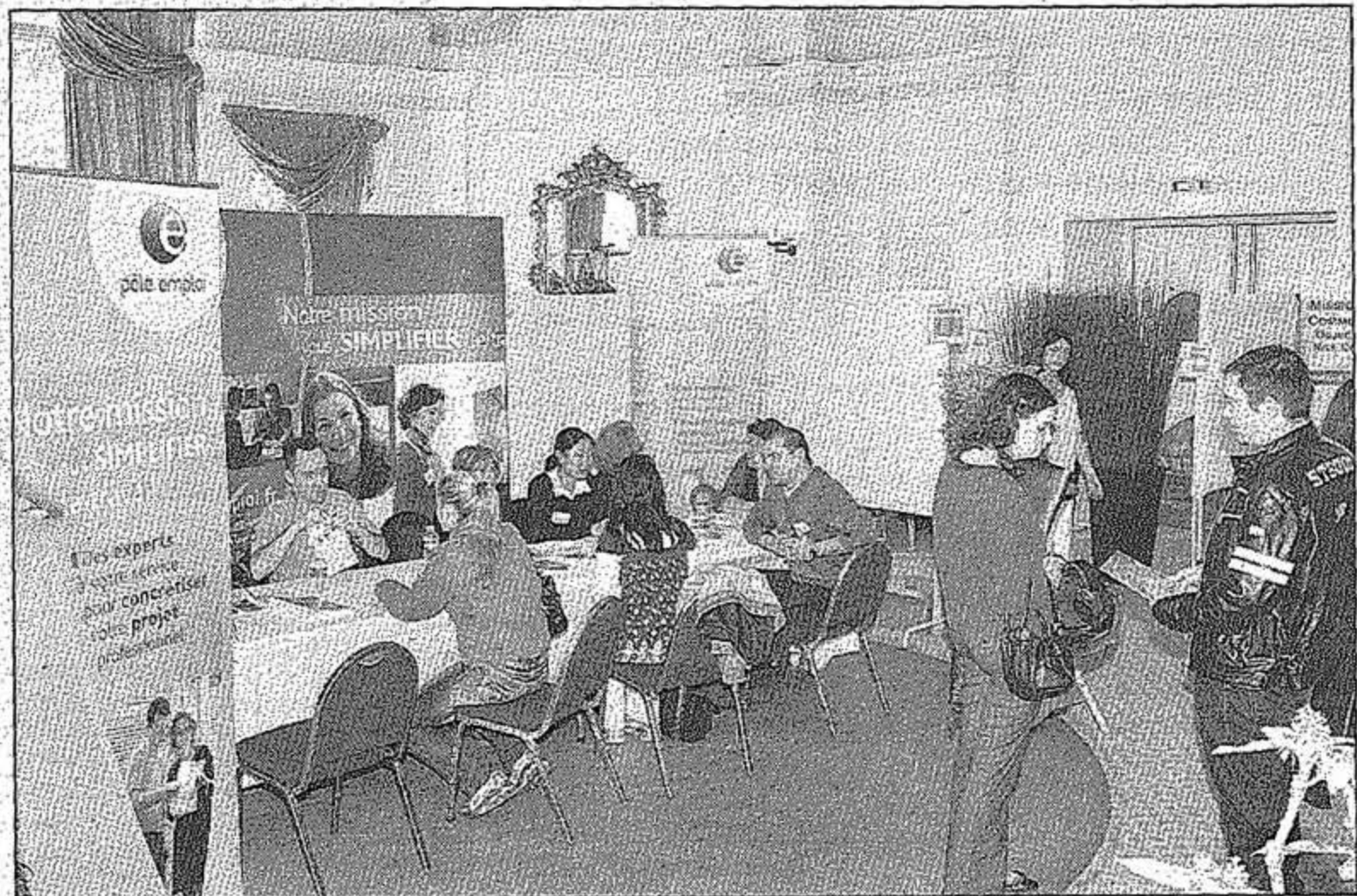
Les demandeurs d'emplois ont également pu trouver des informations sur les aides proposées par les services de l'Etat avec la présence de la Mission Locale, du Pole emploi ainsi que du PLIE.

Au bilan de fin de journée, ce sont près de 550 personnes qui ont pris des contacts en l'espace de cinq heures, ce qui représente néanmoins une légère baisse par rapport à l'an dernier. Des hommes et des femmes pour une population âgée de 30 à 40 ans en moyenne.